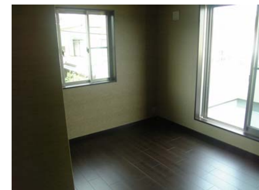
主寝室 …落ちついた配色に