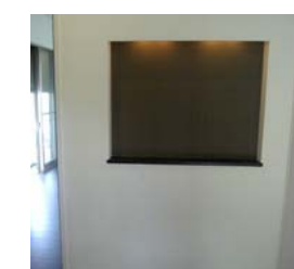
玄関ホールニッチ …御趣味の魚拓を飾る所に