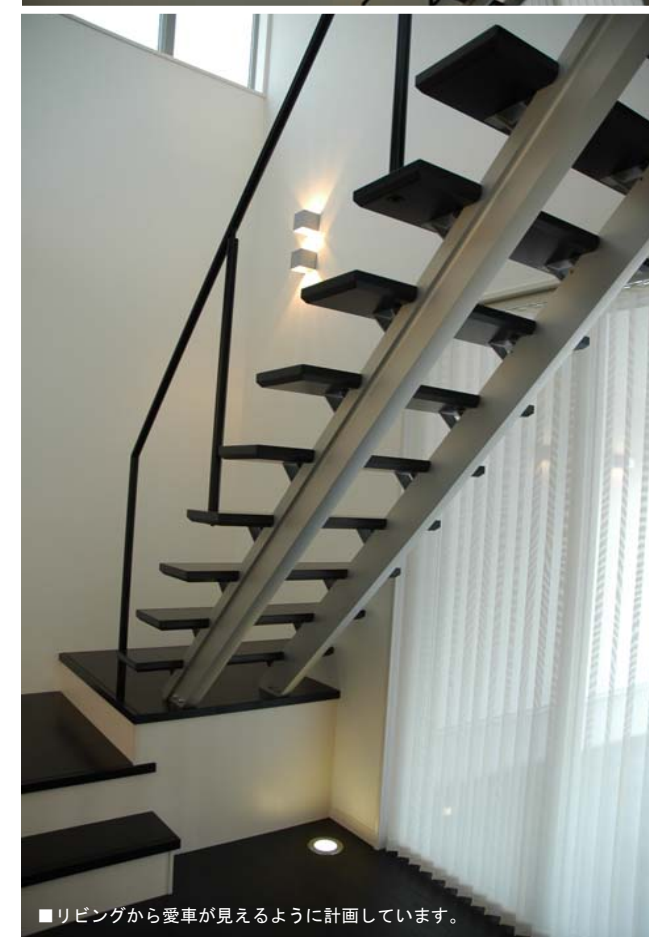
■リビングから愛車が見えるように計画しています。