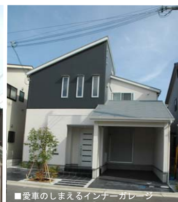
■愛車のしまえるインナーガレージ