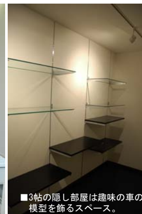
■3帖の隠し部屋は趣味の車の模型を飾るスペース。