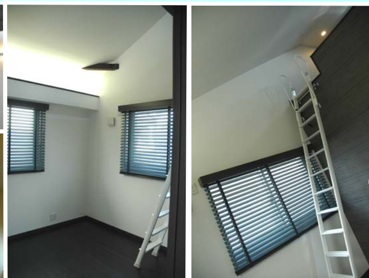
■BLACK×WHITE リビングには吹抜けを。黒い化粧梁と階段が大空間のアクセントになっています。