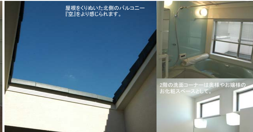
屋根をくりぬいた北側のバルコニー『空』をより感じられます。