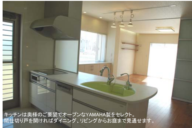
キッチンはお客様のご要望でオープンなYAMAHA製をセレクト。間仕切り戸を開ければダイニング、リビングからお庭まで見通せます。