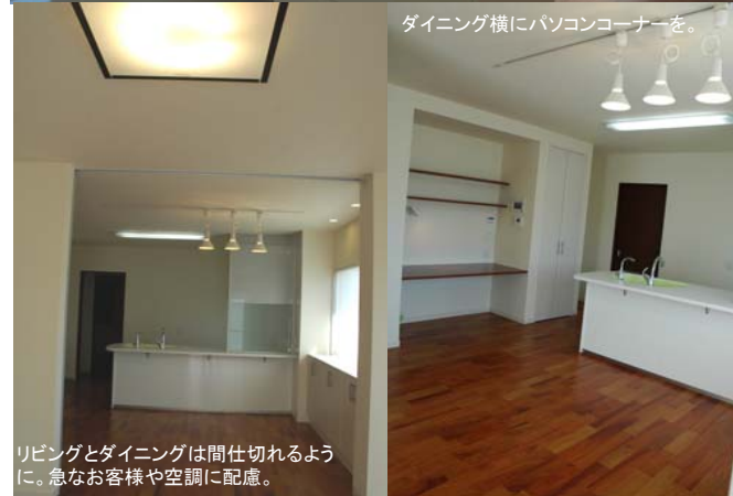
ダイニング横にパソコンコーナーを。