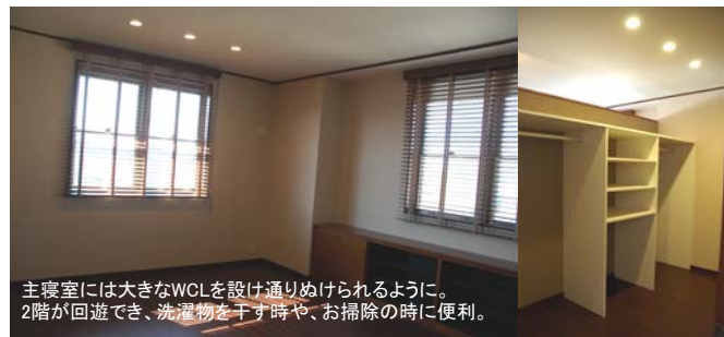
主寝室には大きなWCLを設け通りぬけられるように。2階が回遊でき、洗濯物を干す時や、お掃除の時に便利。