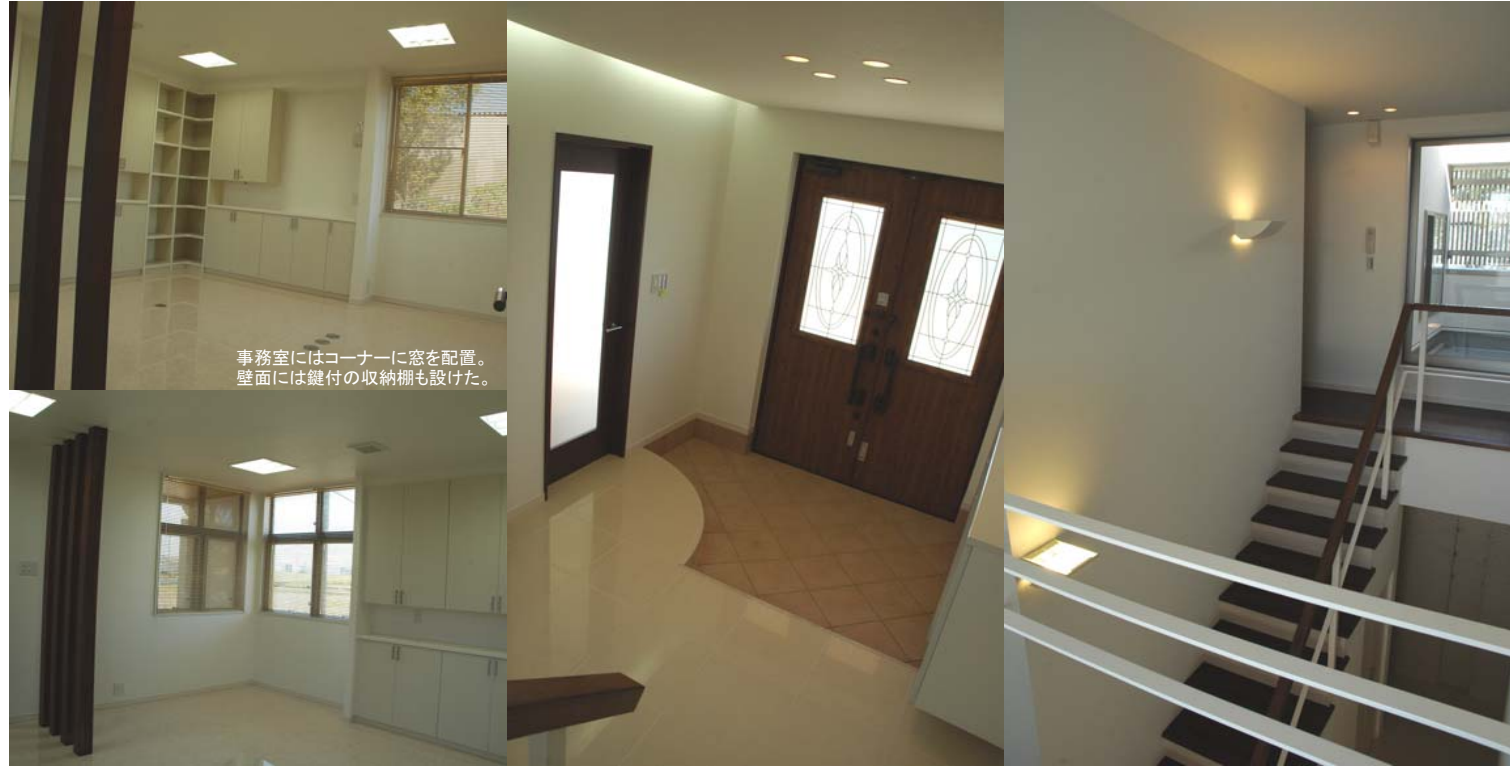
事務室にはコーナーに窓を配置。壁面には鍵付の収納棚も設けた。