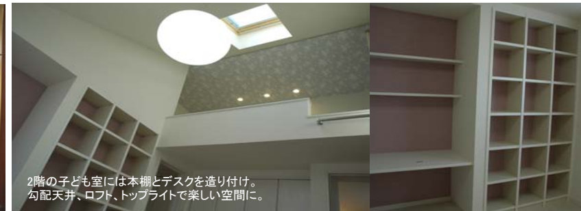
2階の子ども室には本棚とデスクを造り付け。勾配天井、ロフト、トップライトで楽しい空間に。

所在地: 加古川市 敷地面積: 330.29㎡ [99.8坪] 延べ床面積: 234.38㎡ [70.89坪]