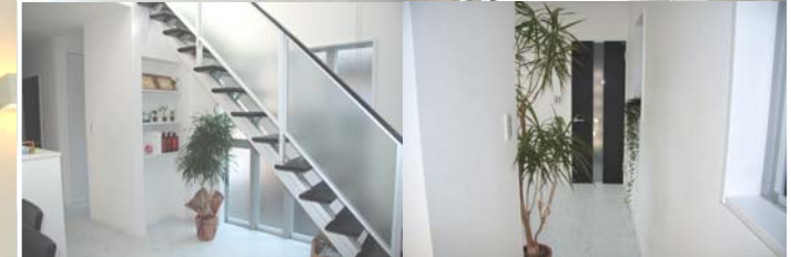
造り付けのTV台・TEL台はご主人、ストリップ階段の下は奥様お気に入りのスペースです。